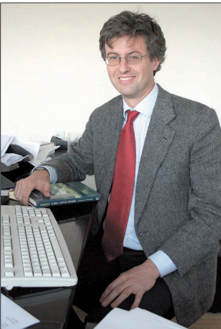
Implementacija Evropskih direktiva predstavlja obavezu za države članice EU: Prof. dr Alesandro Simoni

- Veoma je teško izvršiti takvo rangiranje, budući da su zakoni kojima se pravila direktive unose u domaće pravo samo deo šire slike. Nekoliko država je i pre usvajanja direktiva imalo pravila koja su se, barem u teoriji, mogla primenjavati na slučajeve diskriminacije i ponekad ova pravila i dalje postoje kao paralelni pravni režim zajedno sa novim zakonima. Osim toga, ovde je, kao i uvek, za primenu zakonskih pravila veoma značajno da nekoliko glavnih aktera - upravni organi, sudovi, pravnici, naučna javnost, sindikati - budu svesni socijalnih problema koji leže iza svega toga. Čak i sa najboljim zakonima, antidiskriminaciona kultura ne može nastati preko noći. U svakom slučaju, situacija je različita za različite osnovne diskriminacije. Kao što se sećate, postojao je politički konsenzus oko uvođenja pravila o zabrani diskriminacije u svim oblastima po osnovu rase i etničkog porekla, dok je u odnosu na veroispovest, seksualnu orijentaciju, invalidnost, uzrast, bilo moguće samo usvojiti direktivu ograničenu na oblast zapošljavanja.