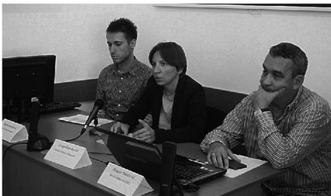
БЕЗБЕДНОСТ И ДАЉЕ НА ПРВОМ МЕСТУ: конференција поводом Београд Прајда у Нишу

Како кажу, оно што је занимљиво, јесте велико интересовање људи, с обзиром на то да Инфо центар ради свега недељу дана. На овај начин људима је приближена проблематика дискриминације и неједнак положај с којом се ЛГБТ популација суочава. У Инфо центру грађани могу да дођу и пријаве