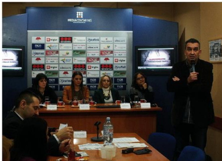
САМО ЗАЈЕДНИЧКОМ АКЦИЈОМ ДО БОЉЕГ ПОЛОЖАЈА РОМА:са конференције за новинаре