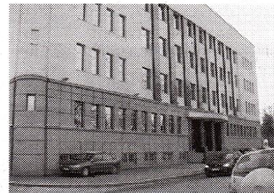
ПРОЈЕКАТ САВЕТА ЕВРОПЕ: Апелациони суд у Нишу

Поред дискује на тему Алтернативних мера притвору, овај догађај представља прилику да се учесницима представи програм ХЕЛП Савета Европе.